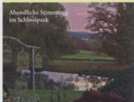
Abendliche Stimmung im Schlosspark

Niederlande Tel. 0031-623903209 Exklusive Blumenzwiebeln und Stauden direkt aus eigener Züchtung