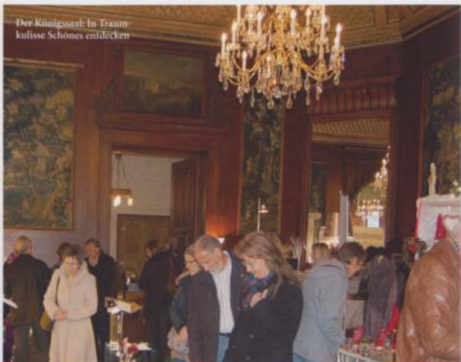
Der Königssaal: In Traum- kulisse Schönes entdecken

25. – 27. Oktober 2013 25. – 27. April 2014 24. – 26. Oktober 2014