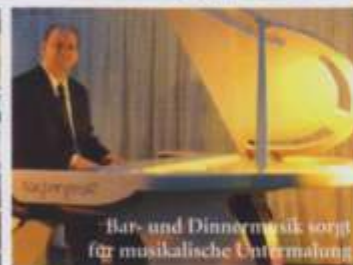
Bar- und Dinnermusik sorgt für musikalische Unterhaltung