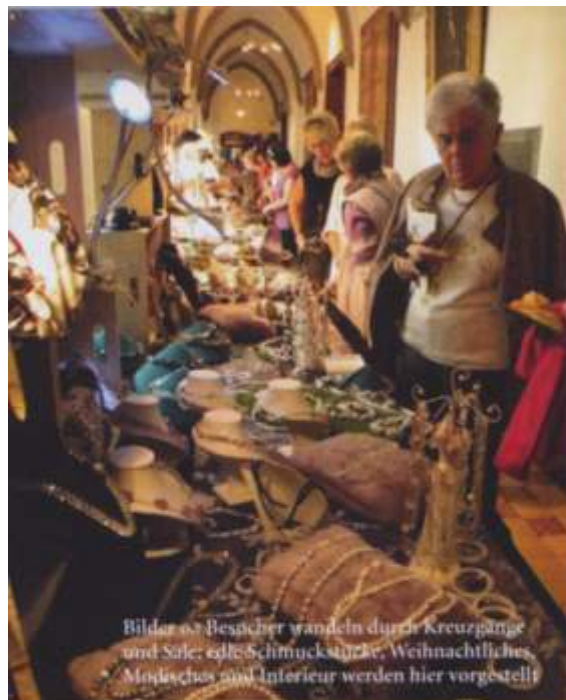
Bilder- & Besucher wandeln durch Kreuzgänge und Sale; edle Schmuckstücke, Weihnachtliches, Modisches und Interieur werden hier vorgestellt