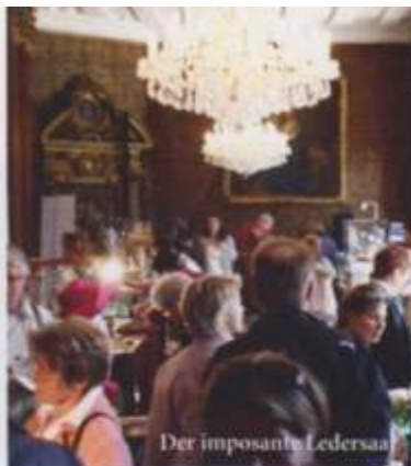
Der imposante Ledersaal