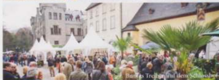
Barbes Treiben auf dem Schlosshof